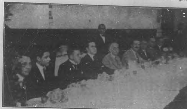
Presidencia del almuerzo con que el estimado colega "Heraldo de Cuba" festejó días pasados el cuarto aniversario de su reparación.

Función ésta que dado el alto espíritu altruista que lleva en sí y lo magnífico del programa confeccionado, ha de resultar un completo éxito.