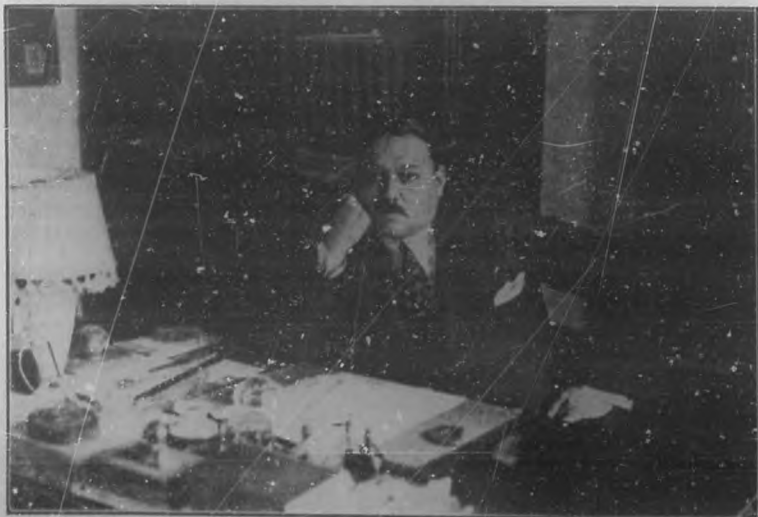
ALBERTO INSUA El insigne novelista que acaba de publicar una interesante novela con el título de "El negro que tenía el alma blanca".

hace aplaudir, porque su lógica es convincente y su pensamiento es alto, de la élite más culta y mejor preparada.