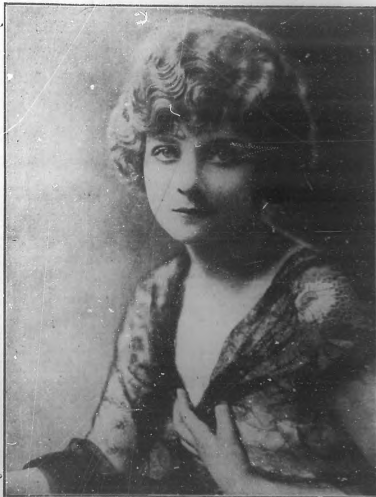
ALICE TERRY La brillante estrella de la "Metro", que acaba de visitarnos en compañía de su esposo el conocido director Rex Imgram.