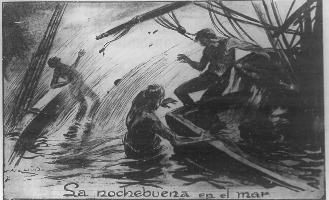
POR G. JIMENEZ LAMAR

TROCADERO NUMEROS 89-93. — TELEFONO A-5658.