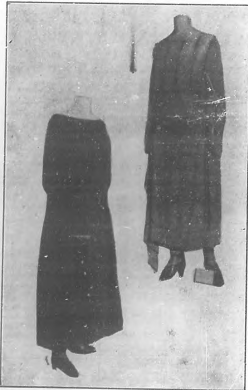
La moda actual.— Dos modelos de calle.

Pero a quien se le ocurre el confiar a la interesada inventiva