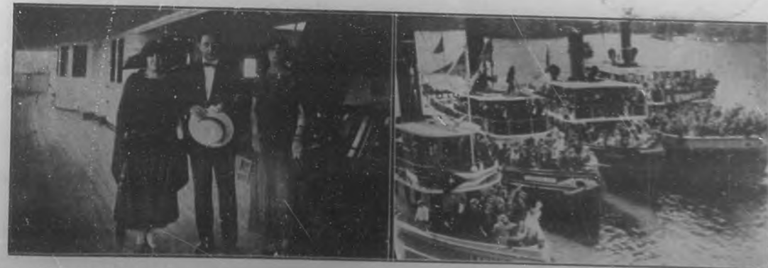
La notable actriz Lola Membrives y el eminente actor Ricardo Puga, figuras principales de la compañía que trae Benavente