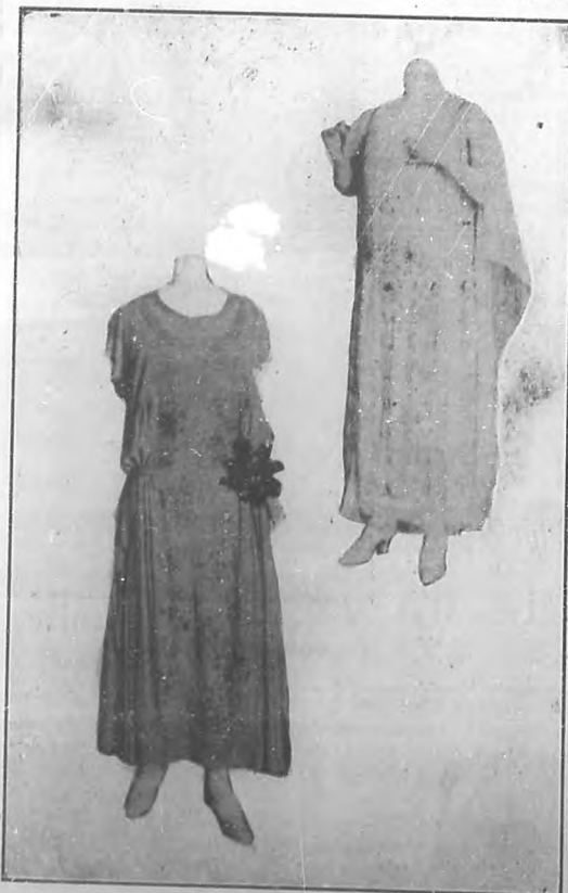
La moda actual.— Dos modelos de salón.